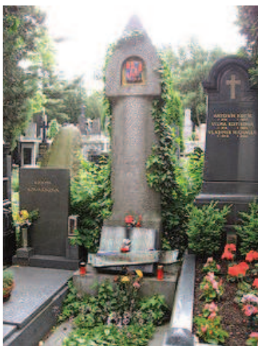
Hrob Karla Čapka a Olgy Scheinpflugové na Vyšehradském hřbitově v Praze