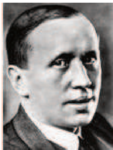
Karel Čapek – narozen 9. ledna 1890 - zemřel 25. prosince 1938