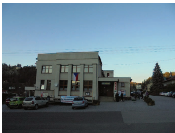
Sokolovna na Malé Skále